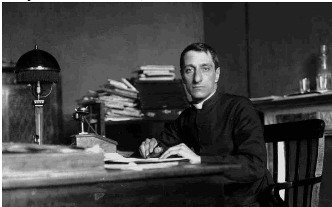
Don Luigi Sturzo (1871-1959) vedeva nell'Italia unitaria un "vestito" che enfatizza i vizi e non le virtù delle sue popolazioni